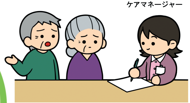
ケアマネージャー