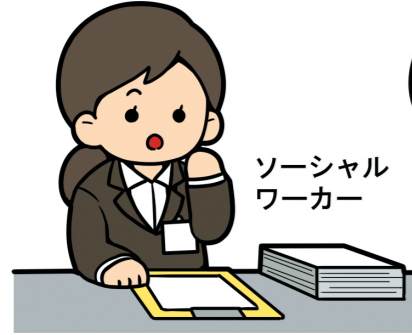
ソーシャル ワーカー