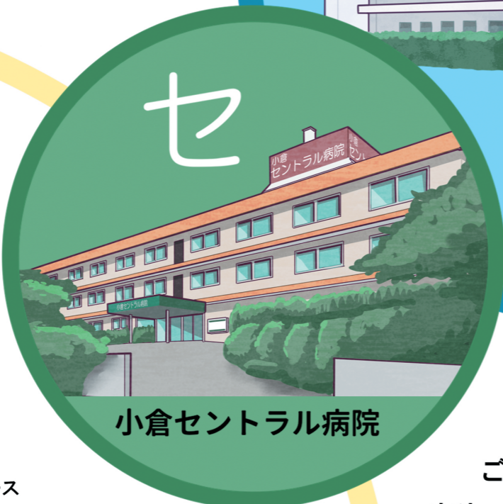
小倉セントラル病院