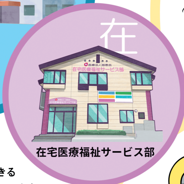
在宅医療福祉サービス部