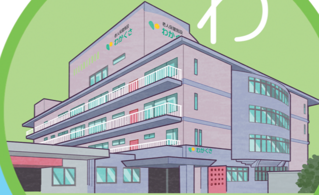
介護老人保健施設 わかくさ